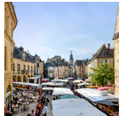
Le marché de Sarlat