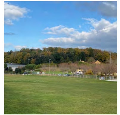
Plaine des sports de Sarlat