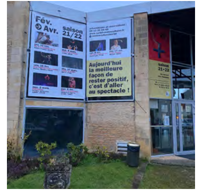
Les Initiatives Culturelles Concertées

travers lequel il porte une ambition forte pour cette filière, qui contribue à la renommée du territoire. Ce programme se déclinera en actions pour lutter contre la propagation de l'influenza aviaire dans un contexte d'urgence, développer une autonomie territoriale en canetons et oisons, accompagner la biosécurité et les investissements des exploitations, soutenir l'expérimentation, l'innovation, la recherche et la formation, l'adaptation des structures d'abattage et relancer la filière gras au travers d'une importante campagne de promotion et de communication. Chaque action sera élaborée en étroite concertation avec la profession. C'est dans ce cadre que s'inscrit le projet de création d'un abattoir à Sarlat.