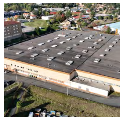
Le projet de création de studios de cinéma