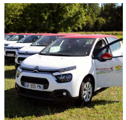
Le plan 1000 voitures

Réponse attendue avant le printemps 2023.